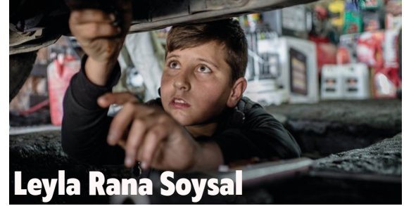
Leyla Rana Sosyal

Mesleki ve Teknik Eğitim Müdürlüğüne bağlı olarak çalışan Mesleki Eğitim Merkezleri (MESEM)'inde 1,5 milyon kayıtlı çocuk işçi bulunmaktadır. MESEM'lere öğrenciler ustalık ve kalfalık eğitimi almak için kayıt yaptırırlar. 11. sınıfın sonunda kalfalık belgesi alan çocuk işçiler, 12. sınıfın sonunda ise ustalık belgesi alırlar. Bu kapsamda öğrencilerin kayıt yaptırabileceği kuaförlük, harita-tapu-kadastro, motorlu araç teknolojisi, gemi yapımı, makine teknolojisi, metal teknolojisi, inşaat teknolojisi gibi 39 alan ve toplam 193 dal bulunmaktadır.